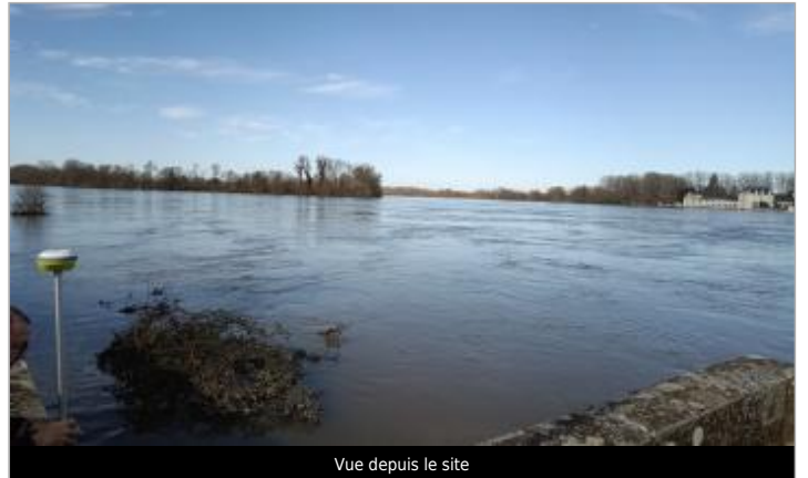
Vue depuis le site

GÉOLOCALISATION Coordonnées WGS84 : X: -0.52463805 / Y: 47.41972690 Coordonnées RGF93 (Lambert 93) X: 434344.42 / Y: 6708083.19 Coordonnées RGF93 (ETRS89) : X: -0.5246381 / Y: 47.4197269 Code Hydro: ----0000 Rive de référence: