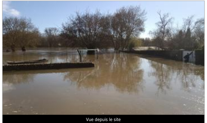
Vue depuis le site