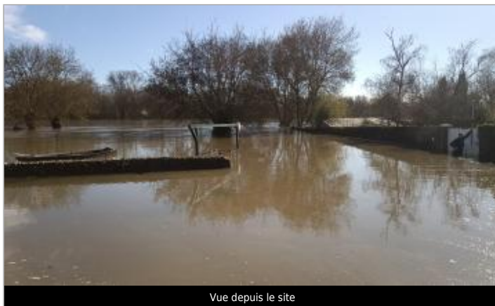
Vue depuis le site