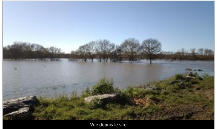
Vue depuis le site