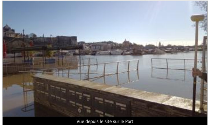
Vue depuis le site sur le Port