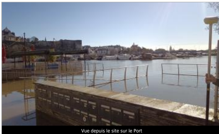
Vue depuis le site sur le Port