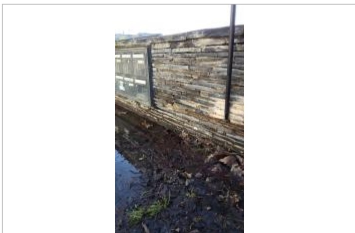
Vue sur la laisse d'inondation et le point de mesure