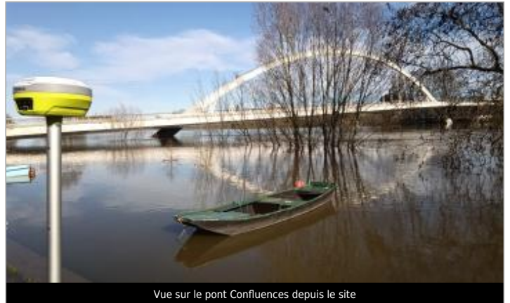
Vue sur le pont Confluences depuis le site