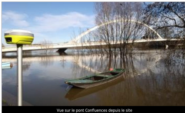
Vue sur le pont Confluences depuis le site