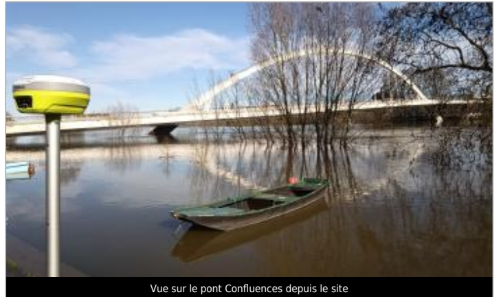
Vue sur le pont Confluences depuis le site