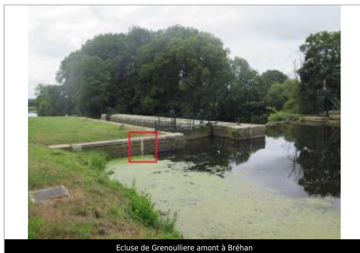
Ecluse de Grenouliere amont à Bréhan

GÉOLOCALISATION Coordonnées WGS84 : X: -2.67870822 / Y: 48.01859850 Coordonnées RGF93 (Lambert 93) X: 276997.75 / Y: 6783907.4 Coordonnées RGF93 (ETRS89) : X: -2.6787082 / Y: 48.0185985 Code Hydro: J8--0230 Rive de référence: Gauche