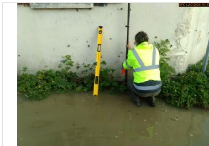
Vue sur la laisse d'inondation