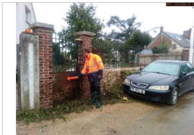
Vue sur la laisse d'inondation