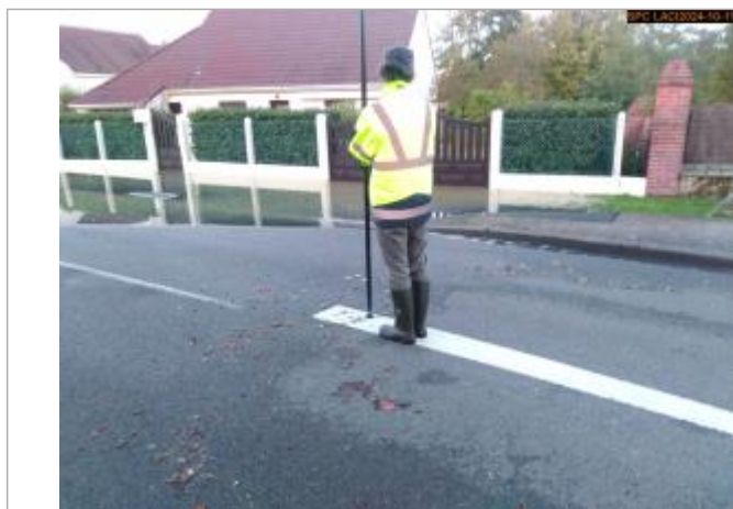
Vue sur la laisse d'inondation