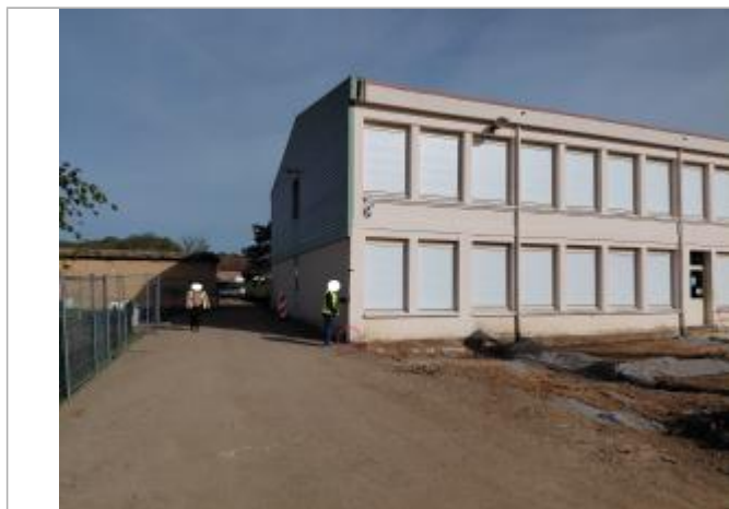
Laisse de crue au pied du bâtiment.

Méthode : GPS Organisme : SPC Seine aval - Côtiers normands Commentaires sur le nivellement : Précision instrument: +/- 1 cm. Nivellement d'EGIS en 2011, estimé d'après la Topo: 66.30 m. Référence nivelée : Marque d'inondation Système altimétrique : NGF IGN 1969 (système normal) Altitude de la référence (en m) : 66.330 m Altitude calculée de l'eau (en m) : 66.33 m