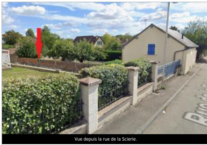
Vue depuis la rue de la Scierie.