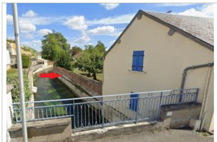
Laisse de crue dans le jardin, 60 cm/sol.

Altitude calculée de l'eau (en m) : 63.85 m