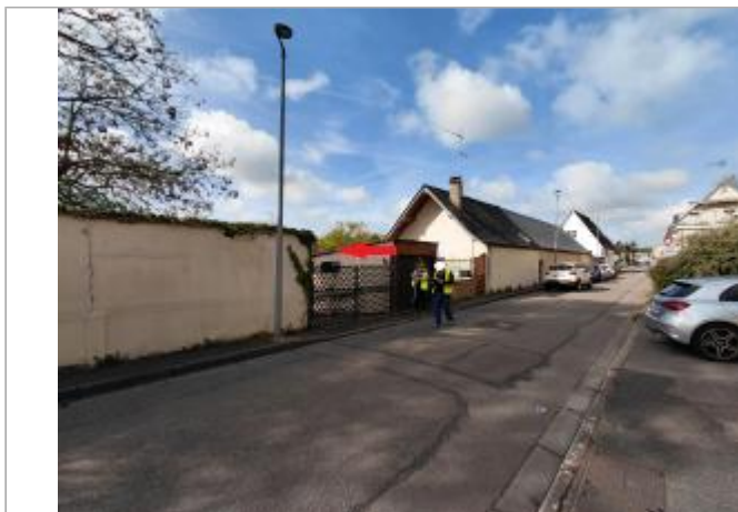
Vue depuis la rue de la Rochette.