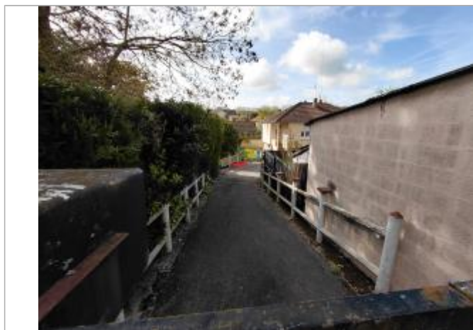
Vue depuis la rue de la Rochette.

Méthode : Estimation à partir d'un MNT Organisme : EGIS-Eau Référence nivelée : Marque d'inondation Système altimétrique : NGF IGN 1969 (système normal) Altitude de la référence (en m) : 64.040 m Altitude calculée de l'eau (en m) : 64.04