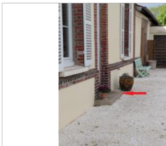
Les eaux sont montées jusqu'à la marche.