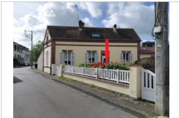
Vue depuis la rue des Tombettes.