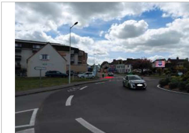
Vue depuis la rue du Faubourg St Léger.