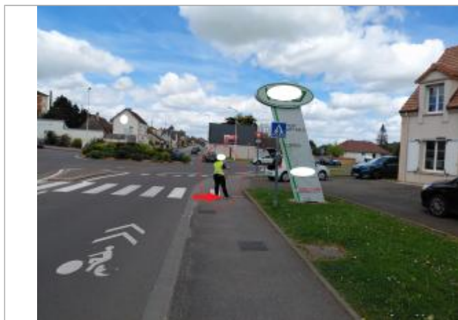
Laisse de crue à + 53 cm/sol.