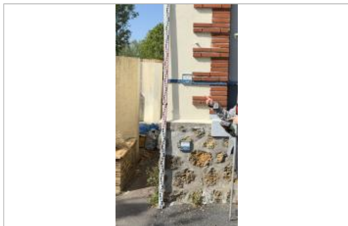
photo des repères