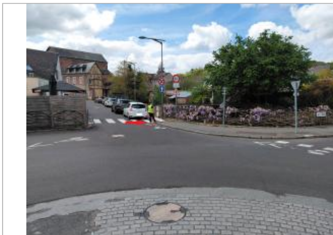
Vue depuis le rond-point.