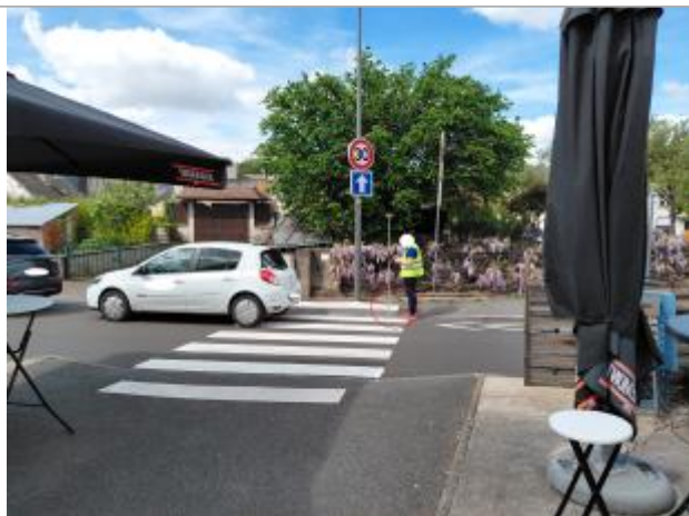
Laisse de crue sur le trottoir.

Altitude calculée de l'eau (en m) : 60.1 m