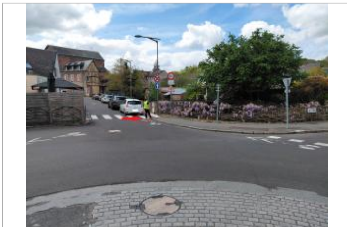
Vue depuis le rond-point.