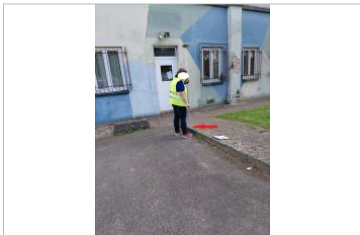
Laisse de crue sur le haut du rebord du trottoir.