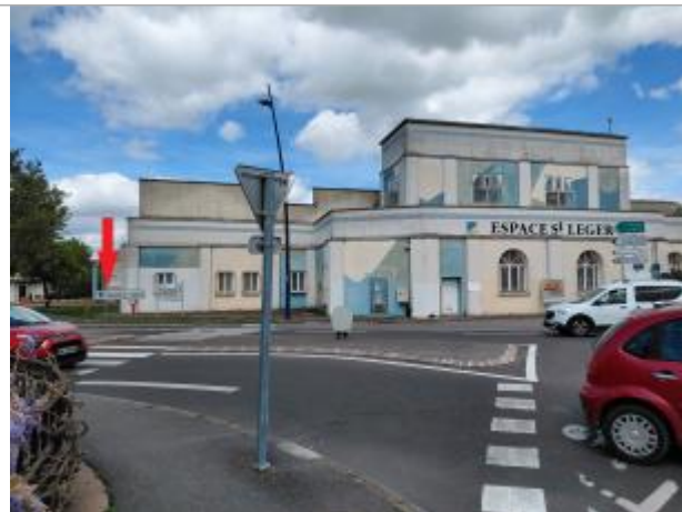
Vue depuis le rond-point de la rue Vigor.