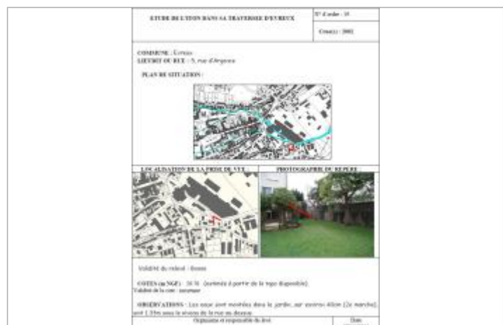
Fiche de laisse de crue de l'étude EGIS.

GÉNÉRAL Code : WEB_R_202605064418 Date de mise à jour : 06/05/2026 Auteur : SPC.SACN