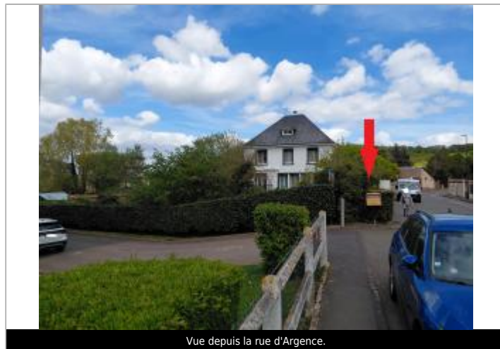
Vue depuis la rue d'Argence.

GÉOLOCALISATION Coordonnées WGS84 : X: 1.16000677 / Y: 49.03268140 Coordonnées RGF93 (Lambert 93) X: 565461.26 / Y: 6882988.84 Coordonnées RGF93 (ETRS89) : X: 1.1600068 / Y: 49.0326814 Code Hydro: Rive de référence: Droite