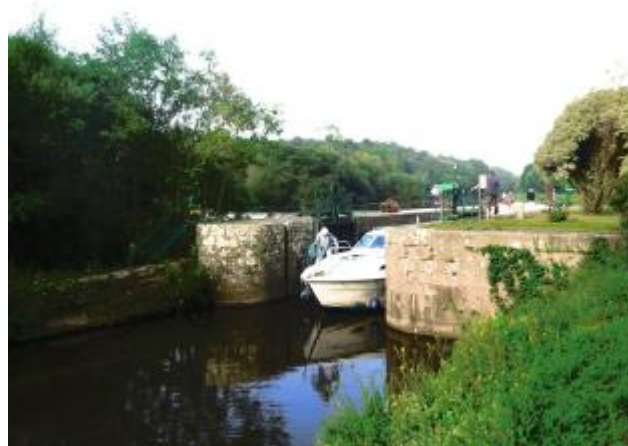
Ecluse de Clan aval à Guillac