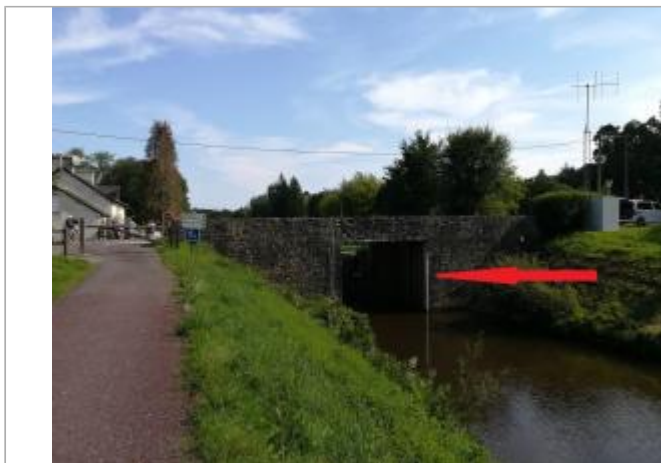
Ecluse de Cadoret à Pleugriffet - station Vigicrues