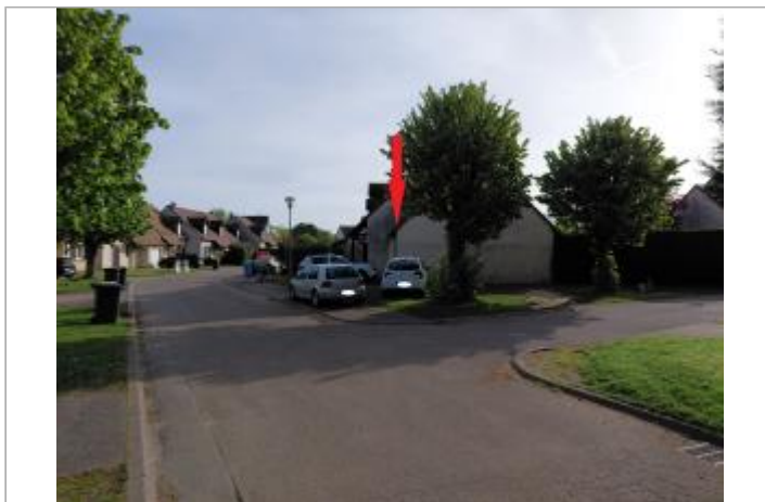
Vue depuis la rue Laennec.