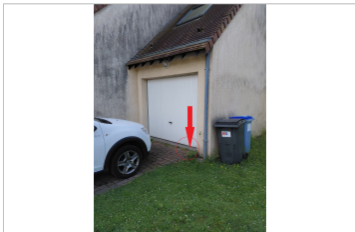
L'eau est montée jusqu'au pied de la porte du garage.

Altitude calculée de l'eau (en m) : 67.5