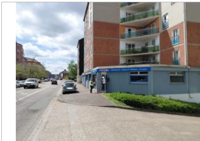
Vue depuis la rue Mendès France.