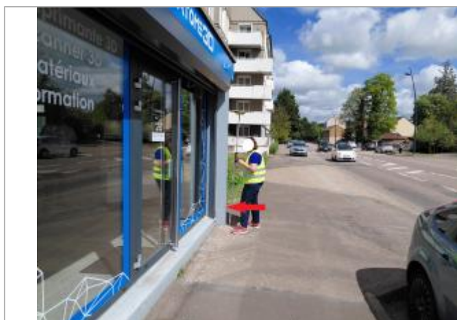
L'eau est montée au niveau du pilier de l'immeuble à environ 30 cm/sol.

Maximum de l'inondation : Oui Visibilité : Oui État du repère : Disparu Pérennité : Aucune Repère calculé : Non PHEC : Non renseigné