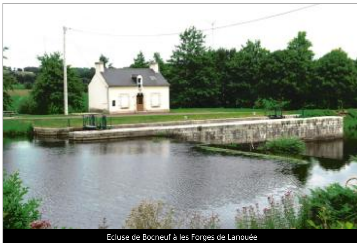
Ecluse de Bocneuf à les Forges de Lanouée