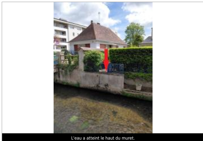
L'eau a atteint le haut du muret.

Altitude calculée de l'eau (en m) : 61.5 m