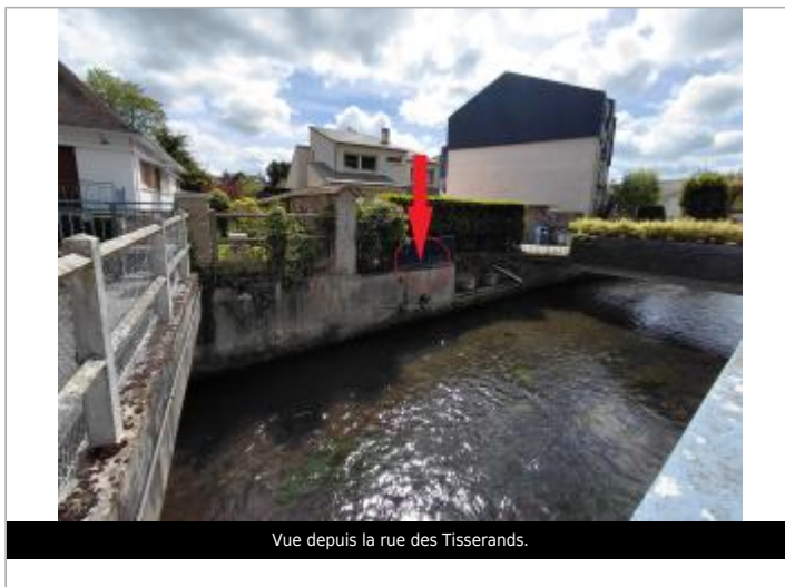
Vue depuis la rue des Tisserands.