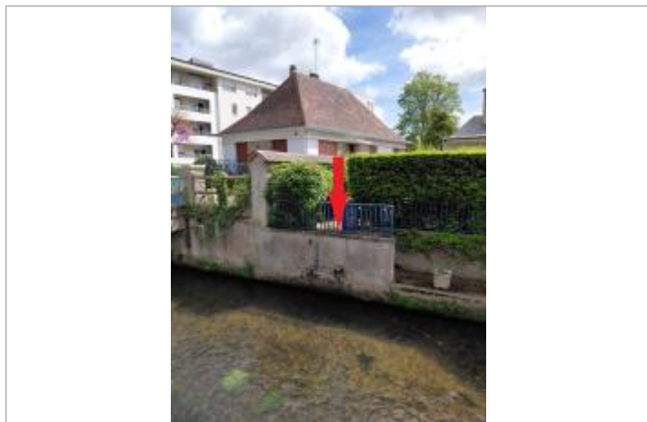
L'eau a atteint le haut du muret.

Altitude calculée de l'eau (en m) : 61.5