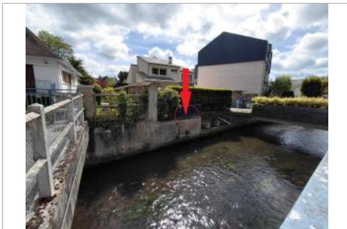
Vue depuis la rue des Tisserands.