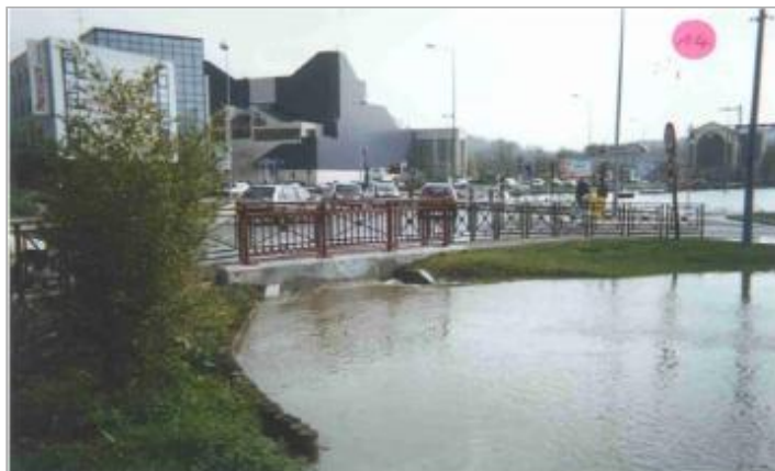
Vue pendant la crue.