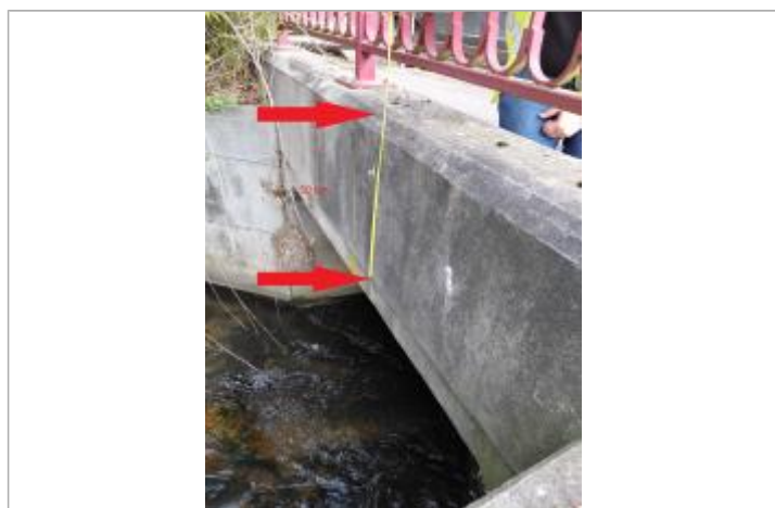
Laisse de crue à - 50 cm/haut du soubassement du pont.

SOURCE DE REPÉRAGE : VISITE DE TERRAIN SPC SACN - 11/03/2020