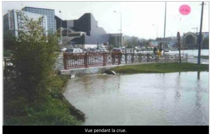
Vue pendant la crue.