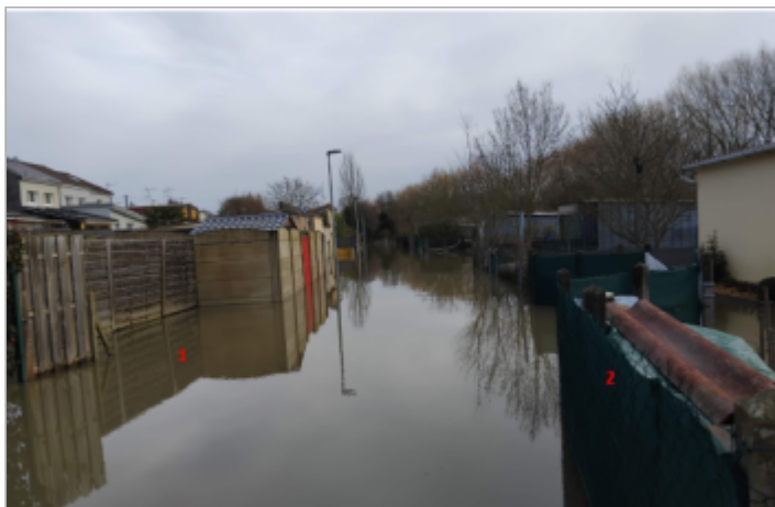
vue d'ensemble du site