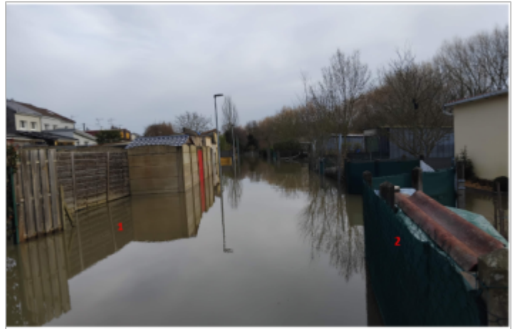
vue d'ensemble du site

GÉOLOCALISATION Coordonnées WGS84 : X: 0.17737632 / Y: 47.98854130 Coordonnées RGF93 (Lambert 93) X: 489489.21 / Y: 6769113.28 Coordonnées RGF93 (ETRS89) : X: 0.1773763 / Y: 47.9885413 Code Hydro: M---0060 Rive de référence: Droite