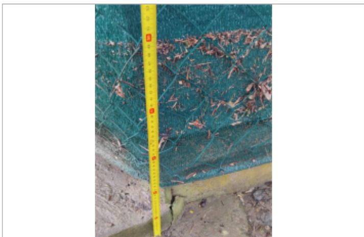
mesure allée rive sarthe

MARQUE Maximum de l'inondation : Oui Visibilité : Non renseigné État du repère : Non renseigné Pérennité : Non renseigné