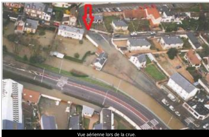
Vue aérienne lors de la crue.