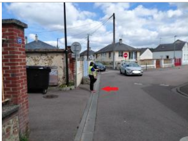
Laisse de crue au sol.

Altitude calculée de l'eau (en m) : 60.74 m