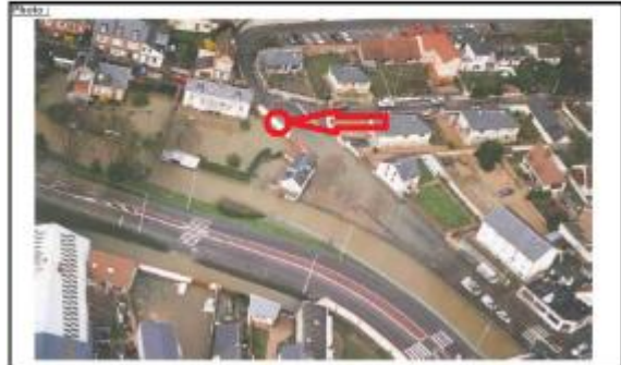
Vue aérienne pendant la crue.

Calme n° : 11 Source : BDTM - planche 6 Localisation : bd du Jardin l'Evêque Photo n° : 39 Cote de la crue : 68.88 en IGN69 (postée) Valeur de la cote : bonne Régime utilisé : niveau de voirie, en amont du pont St-Léger