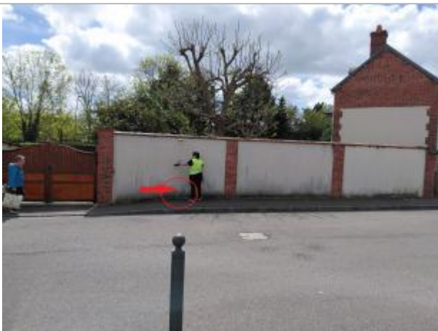
Laisse de crue à 30 cm/sol du trottoir.

Altitude calculée de l'eau (en m) : 61.04 m