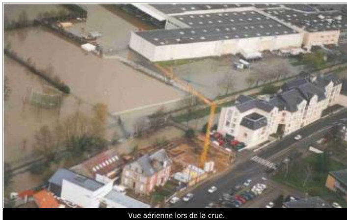
Vue aérienne lors de la crue.