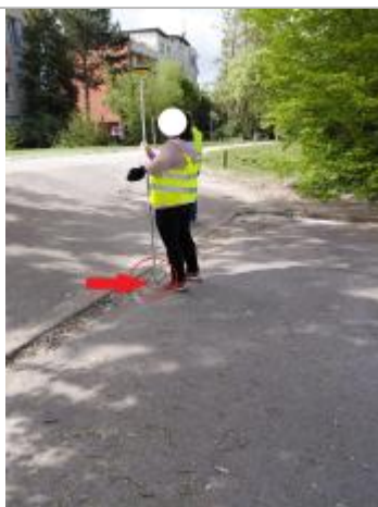
Laisse de crue au sol.

Altitude calculée de l'eau (en m) : 64.7