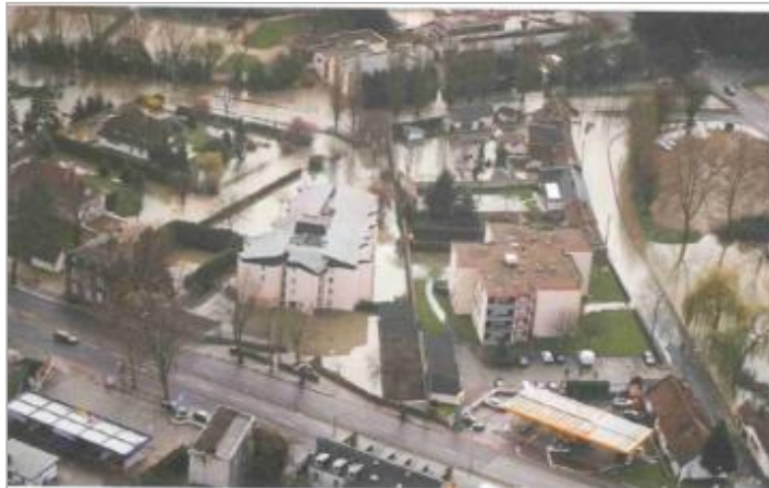
Vue aérienne lors de la crue.