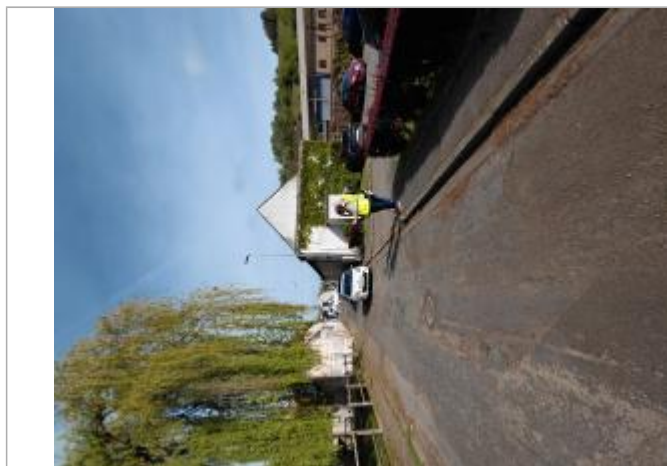
Laisse de crue au sol.

Altitude calculée de l'eau (en m) : 65.45 m