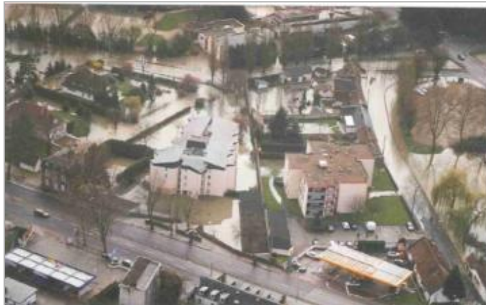
Vue aérienne lors de la crue.