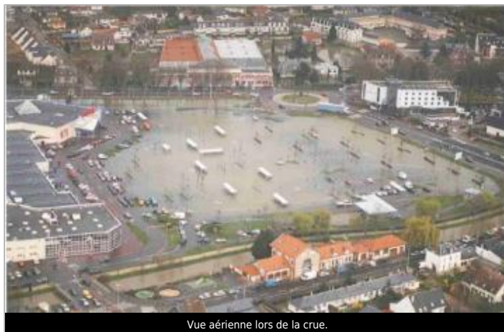
Vue aérienne lors de la crue.