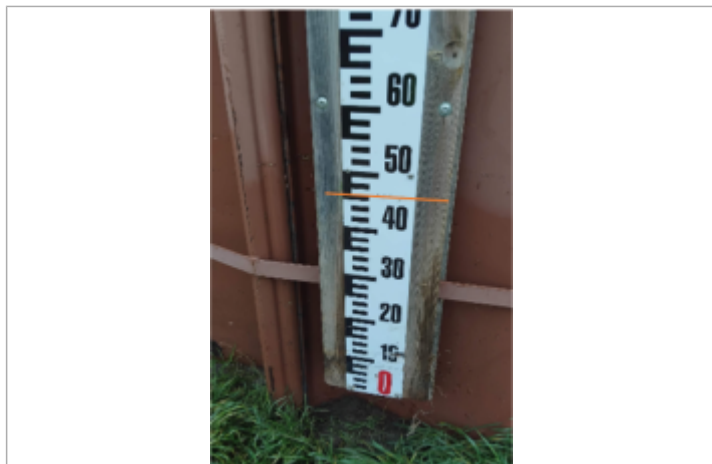
laisse de crue sur l'aval de la digue Australie