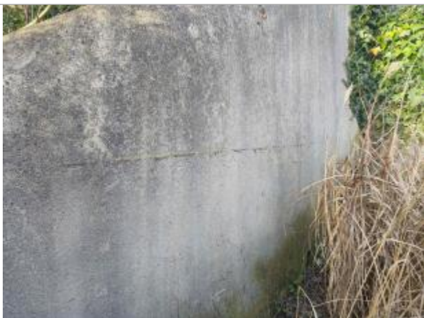
laisse d'inondation sur muret au lavoir de Montbizot

Altitude calculée de l'eau (en m) : 52.67 m