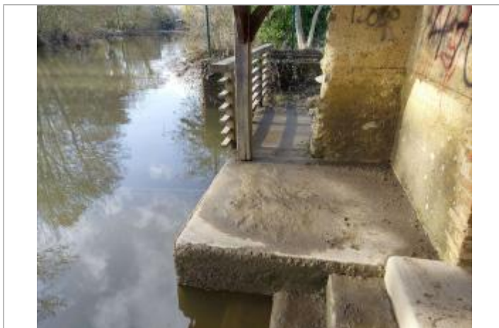
vue du lavoir côté Sarthe