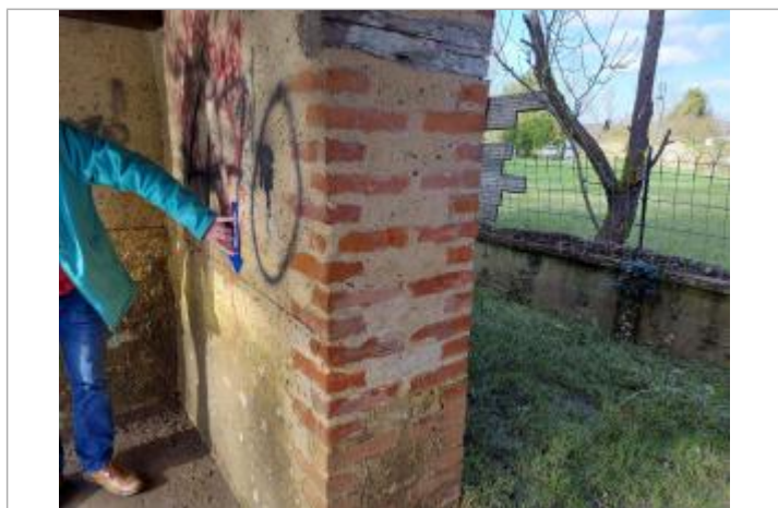
laisse d'inondation, mesurée à 0,87 m au-dessus du sol du lavoir

Maximum de l'inondation : Oui Visibilité : Oui État du repère : Bon Pérennité : Moyenne