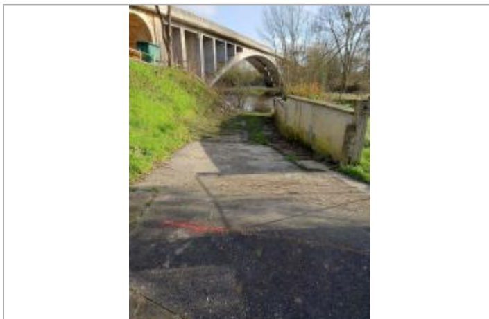
vue du site, en direction de la Sarthe