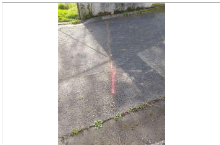
marquage au sol de la laisse d'inondation

Maximum de l'inondation : Oui Visibilité : Oui État du repère : Bon Pérennité : Moyenne