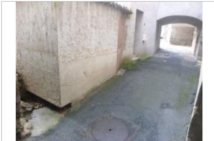
Vue du site, 2024.