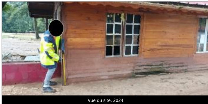
Vue du site, 2024.