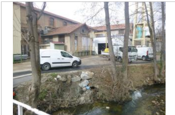
Vue du site, 2024.