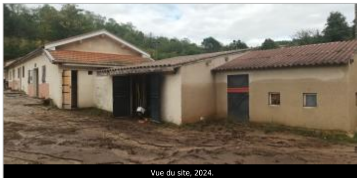
Vue du site, 2024.