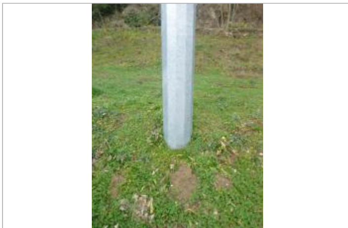
Vue du site, 2024.