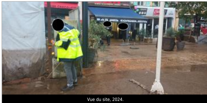
Vue du site, 2024.