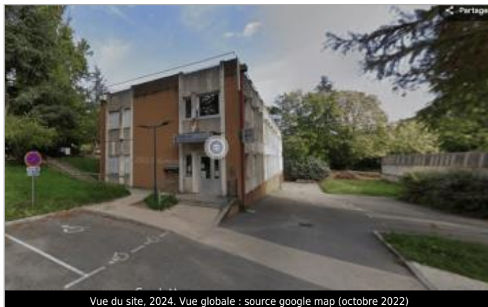
Vue du site, 2024. Vue globale : source google map (octobre 2022)